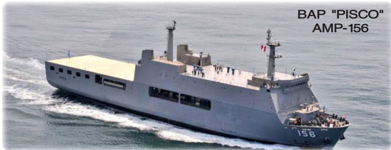
BAP "PISCO" AMP-156