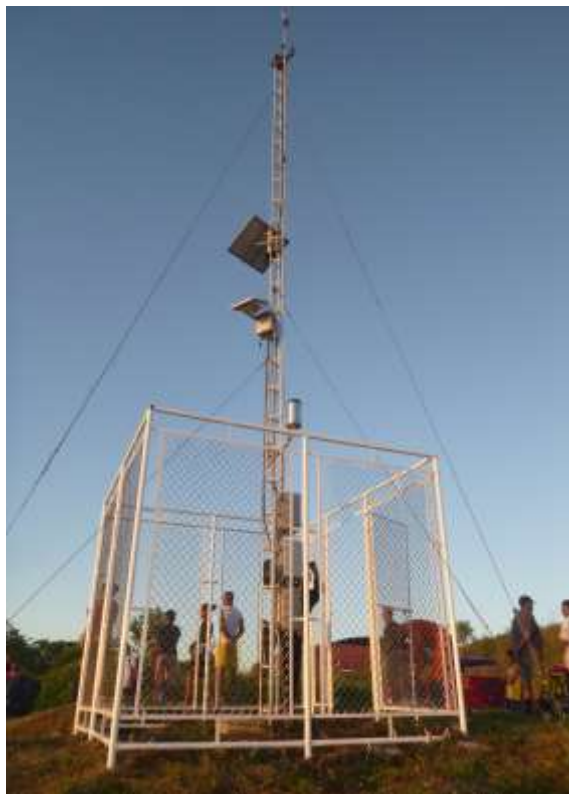
Estación Limnigráfica Requena Río Ucayali