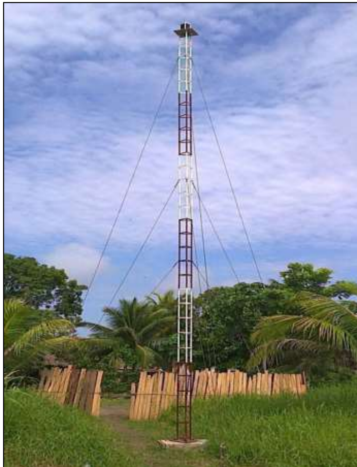
Farolete Juancito – río Ucayali