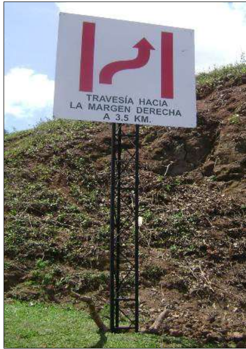
Letrero señalizador de canal río Huallaga