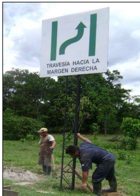
Letrero señalizador de canal río Huallaga