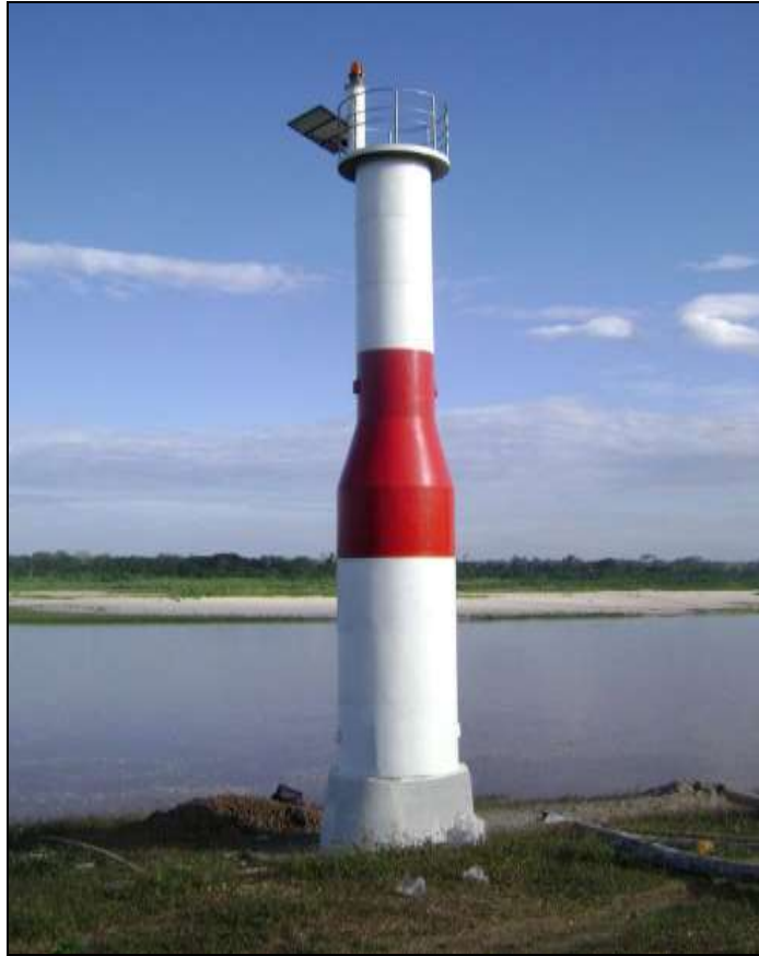
Faro Nueva Reforma – río Huallaga