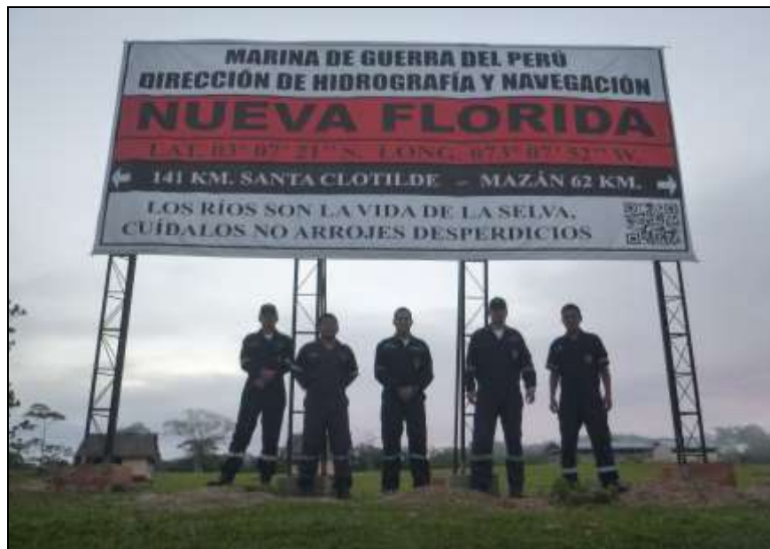
Letrero Identificador de poblado río Napo Rectangular 2.5 x 6 m.