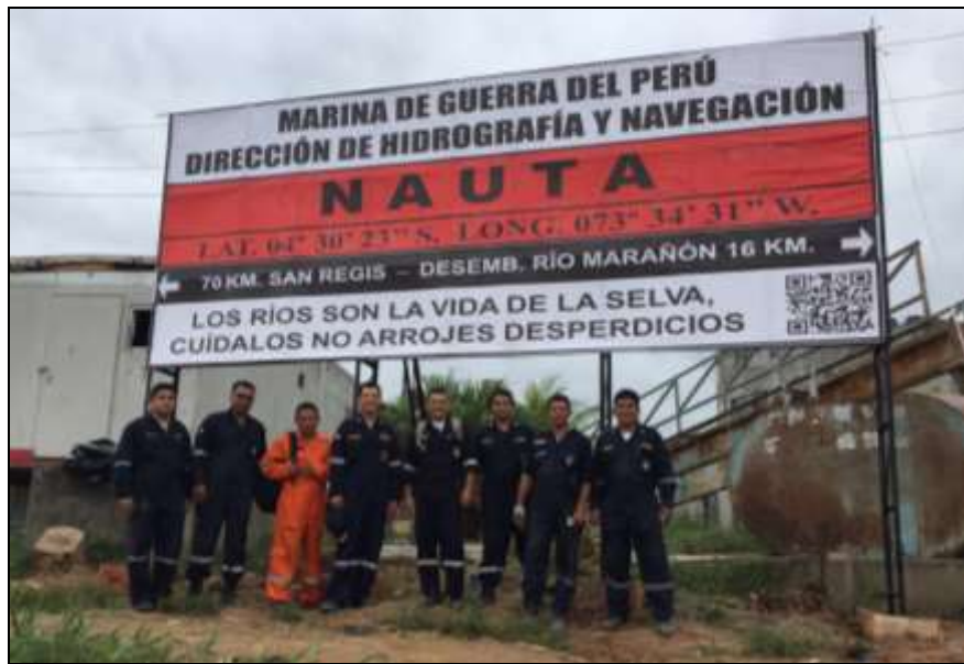
Letrero Identificador de poblado río Marañón Rectangular 2.5 x 6 m.